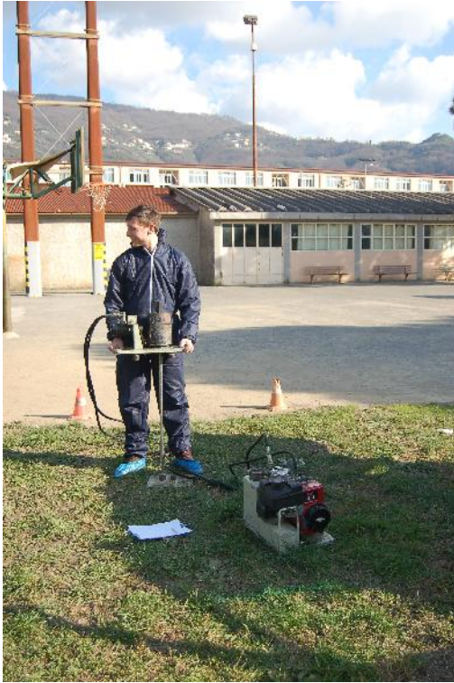
FOTO n.3 Prova penetrometrica DPT n.1