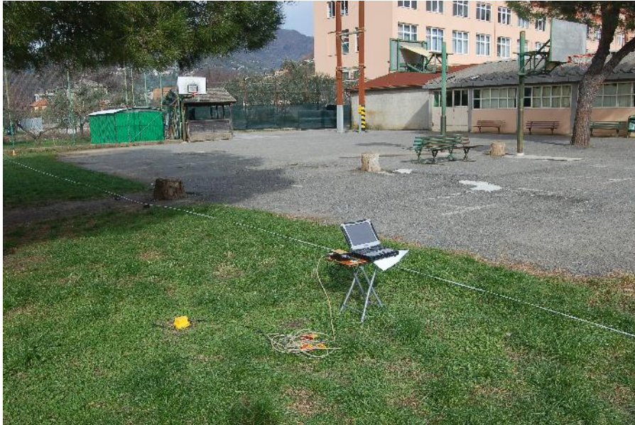
FOTO n.1 localizzazione geofono 3d per prova HVSR