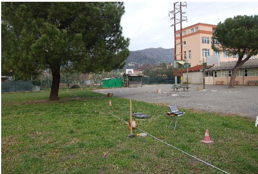
FOTO n.2 localizzazione stesa sismica dei geofoni con massa battente a 2m, i birilli Individuano la posizione delle tre prove penetrometriche. In primo piano la prova n.2, al centro la prova n.3 e la più estrema la prova n.1