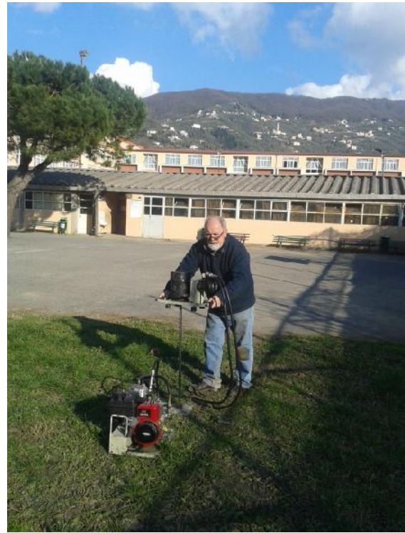
FOTO n.4 prova penetrometrica DPT n.2